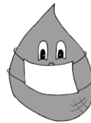
Symbool voor druppel-isolatie