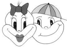
Symbool voor contact-isolatie

Attentie! Om medewerkers en bezoekers op de hoogte te brengen van het feit dat uw kind geïsoleerd verpleegd wordt, hangt er op de kamerdeur van uw kind een kaart met het symbool voor contactisolatie of druppelisolatie of met beide symbolen, afhankelijk van de soort isolatie.